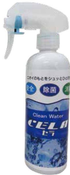
ハンディスプレー(300ml) 0,000円(税別)