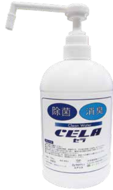
シャワースプレー(700ml) 0,000円(税別)