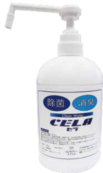
シャワースプレー(700ml) 0,000円(税別)