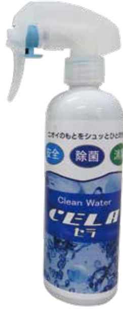
ハンディスプレー(300ml) 0,000円(税別)